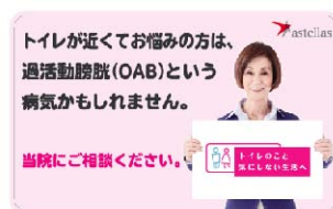
【院内掲示用ステッカー】

医療機関内においても、排尿トラブル症状は、治療で改善できることを広く啓発し、医師に相談できる環境をつくります。