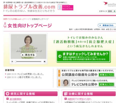
【女性向けトップページ】