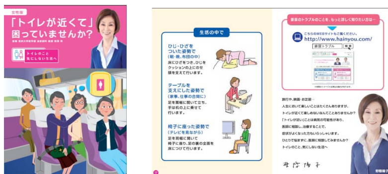
【患者さん向け小冊子】