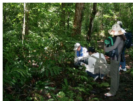
ベトナムでの試料採集の様子