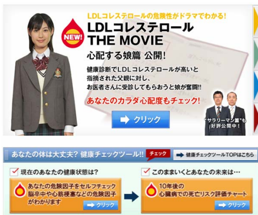
【ウェブサイト・トップページ画面】

スペシャルムービーでは『パパのカラダ心配度チェック THE MOVIE』と題し、LDLコレステロールが高いと指摘されている父親に対し、お医者さんに受診してもらおうと心配する娘が、父親の日常生活に潜む動脈硬化への油断をチェックします。(2009年10月31日公開)