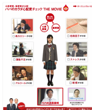
【スペシャルムービー画面】